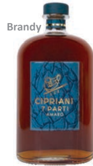
AMARO 7PARTI 6 x 500ml CIP-7534 8005829987534