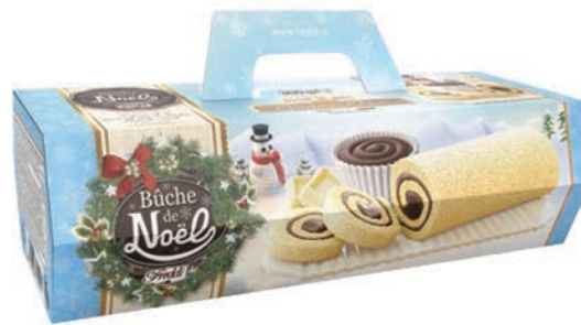
BUCHE DE NOEL 8 x 300g BN-449 8005380899031

Κέικ σε ρολό με γέμιση κρέμας κακάο και φουντούκι, με επικάλυψη από νιφάδες λευκής σοκολάτας.