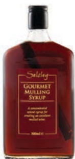
MULLING SYRUP 6 x 500ml SEL-GMS500 5060072100904

Σιρόπι με μπαχαρικά χωρίς αλκοόλ. Ιδανικό για ζεστό κρασί.