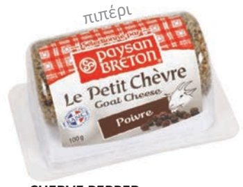
CHEVRE PEPPER 6 x 100g PAB-109901 3412290010992