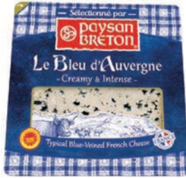
BLUE CHEESE 10 x 125g PAB-117101 3412290011715