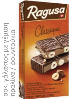
σοκ. γάλακτος με γέμιση πραλίνα / φουντούκια

Η σοκολατοποιία CAMILLE BLOCH ιδρύθηκε το 1929 στην Βέρνη της Ελβετίας με όραμα την παρασκευή σοκολάτας με πρώτες ύλες ανώτερης ποιότητας. Η RAGUSA αποτέλεσε & αποτελεί το πιο αναγνωρίσιμο brand της. Η διαφορά της βρίσκεται στα ορθογώνια κομμάτια σοκολάτας με ολόκληρα φουντούκια.