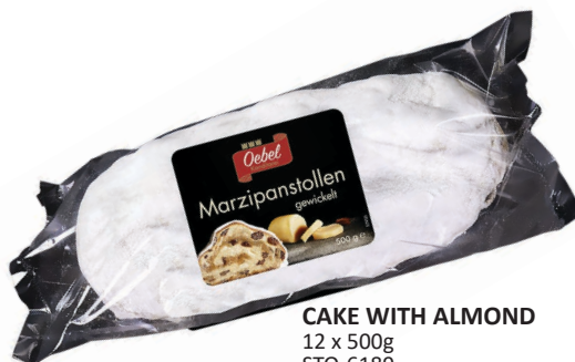
CAKE WITH ALMOND 12 x 500g STO-6189 5709152761894