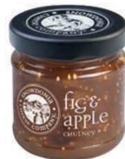
FIG & APPLE CHUTNEY 12 x 114g SNO-669 5060011707669