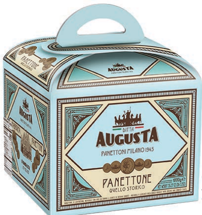
PANETTONE CLASSIC 6 x 1000g AUG-23140 8002873023140