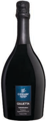
PROSECCO GULIETTA 6 x 750ml CIP-5170 8033389835170