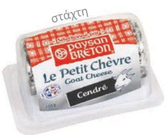
CHEVRE ASH COATED 6 x 100g PAB-109801 3412290010985