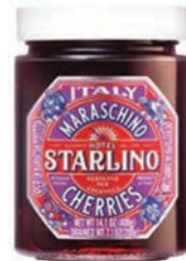
MARASCHINO CHERRIES 12 x 400ml STA-10180 0810035510180