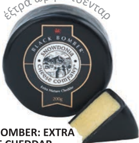
BLACK BOMBER: EXTRA MATURE CHEDDAR 6 x 200g SNO-021 5060011709021