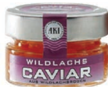
ΑΥΓΑ ΨΑΡΙΩΝ ΑΓΡΙΟΣ ΣΟΛΟΜΟΣ 6 x 50g AKI-50202 4103550010966