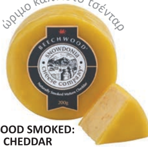
BEECHWOOD SMOKED: MATURE CHEDDAR 6 x 200g SNO-083 5060011709083