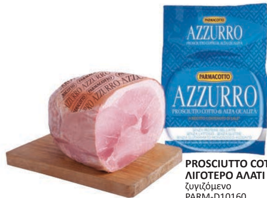
PROSCIUTTO COTTO 30% ΛΙΓΟΤΕΡΟ ΑΛΑΤΙ ζυγίζόμενο PARM-D10160

PROSCIUTTO COTTO HIGH QUALITY ζυγίζόμενο PARM-D10550