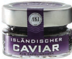
ΑΥΓΑ ΨΑΡΙΩΝ ΟΞΥΡΡΥΓΧΟΣ ΜΑΥΡΟΣ 6 x 100g AKI-53100 5701087011006