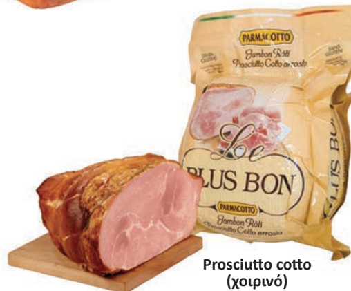
Prosciutto cotto (χοιρινό) χωρίς γλουτένη