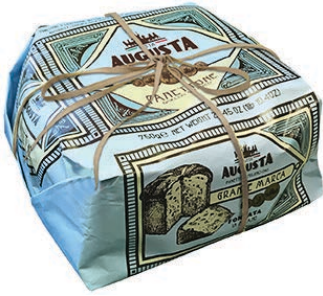
PANETTONE CLASSIC 6 x 750g AUG-23157 8002873023154