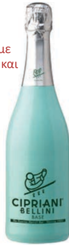
BELLINI BASE 5,5% 6 x 750ml CIP-24289 8005011002489