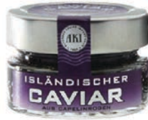
ΑΥΓΑ ΨΑΡΙΩΝ ΟΞΥΡΡΥΓΧΟΣ ΜΑΥΡΟΣ 6 x 50g AKI-53050 5701087010504