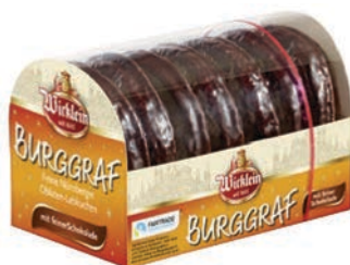
SOFT BISCUIT WITH DARK CHOCOLATE 21 x 200g LEB-494 4008355000122