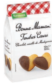
CHOCOLATE CAKE 7 x 175g BM-042272 3178530422726