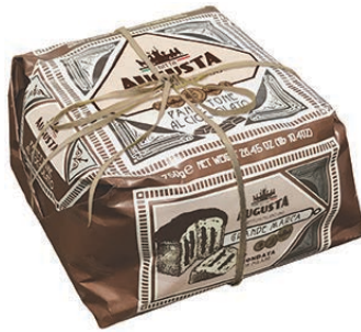
PANETTONE CHOCOLATE 6 x 750g AUG-23188 8002873023188