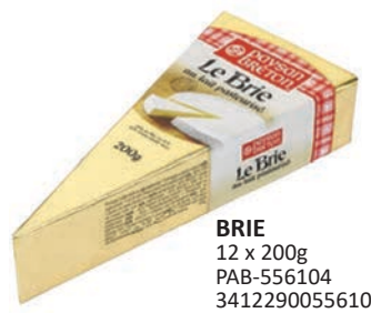
BRIE 12 x 200g PAB-556104 3412290055610