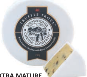
TRUFFLE TROVE: EXTRA MATURE CHEDDAR WITH BLACK SUMMER TRUFFLE 6 x 150g SNO-007 5060011709007