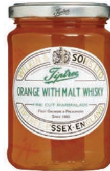
ORANGE WITH WHISKY 6 x 340g TIP-68811 043647688019