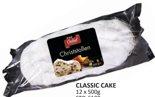
CLASSIC CAKE 12 x 500g STO-6188 5709152761887

Το STOLLEN είναι ένα κέικ με ζαχαρωμένα ή αποξηραμένα φρούτα, ξηρούς καρπούς ή αμυγδαλόπαστα, επικαλυμμένο με ζάχαρη άχνη. Πρόκειται για παραδοσιακό Γερμανικό έδεσμα που τρώγεται κατά την περίοδο των Χριστουγέννων.