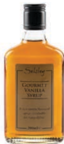
VANILLA SYRUP 6 x 200ml SEL-GVS200 5060072101017

Σιρόπι με μπαχαρικά χωρίς αλκοόλ. Τέλειος συνδυασμός με παγωτό, γιαούρτι, ροφήματα, σαλάτες.