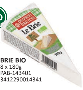
BRIE BIO 8 x 180g PAB-143401 3412290014341