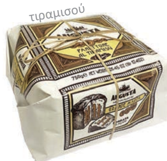
PANETTONE TIRAMISU 6 x 750g AUG-26257 8002373026257