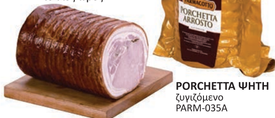
PORCHETTA ΨΗΤΗ ζυγίζόμενο PARM-035A

Η πορκέτα είναι ένα μεγάλο κομμάτι χοιρινού κρέατος που τυλίγεται σε ρολό και αργοψήνεται για πολλές ώρες.