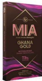
DARK CHOCOLATE 73% 12 x 85g MIA-102 819229021020