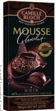
μαύρη σοκολάτα με γέμιση μους

μαλακά κομμάτια σοκολάτας με γέμιση μους σοκολάτας