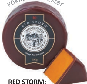
RED STORM: VINTAGE RED LEICESTER 6 x 200g SNO-106 5060011709106