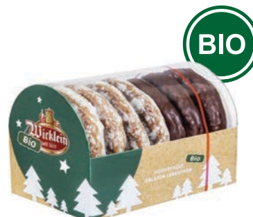
SOFT BISCUIT 18 x 200g LEB-4454 4008355030112

Το LEBKUCHEN είναι ένα παραδοσιακό Γερμανικό ψημένο Χριστουγεννιάτικο μπισκότο παρόμοιο με μελόψωμο. Τα συστατικά του περιλαμβάνουν συνήθως μέλι, μπαχαρικά όπως γλυκάνισο, κόλιανδρο, γαρίφαλο, τζίντζερ, κάρδαμο και μπαχάρι, ξηρούς καρπούς συμπεριλαμβανομένων αμυγδάλων, φουντουκιών και καρυδιών, ή ζαχαρωμένα φρούτα και έχει συνήθως στρογγυλό σχήμα.