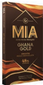
MILK CHOCOLATE 48% 12 x 85g MIA-111 819229021112