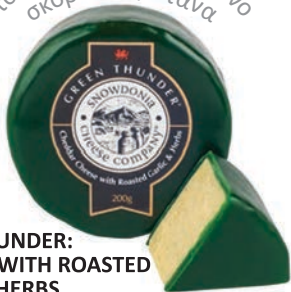
GREEN THUNDER: CHEDDAR WITH ROASTED GARLIC & HERBS 6 x 200g SNO-038 5060011709038