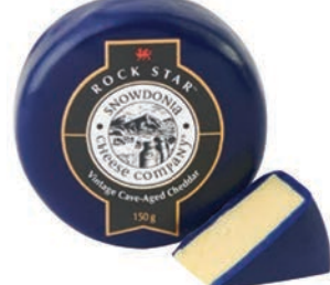
ROCK STAR: VINTAGE CAVE-AGED CHEDDAR 6 x 150g SNO-994 5060011708994