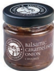
BALSAMIC ONION CHUTNEY 12 x 100g SNO-683 5060011707683

Gourmet chutneys. Συνδυάζονται τέλεια με τα τυριά Snowdonia σελ. 3