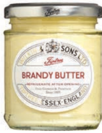
BRANDY BUTTER 6 x 170g TIP-63519 043647635099