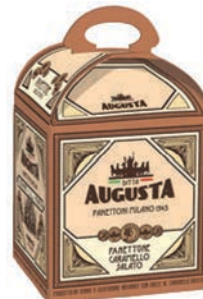
PANETTONE SALTED CARAMEL