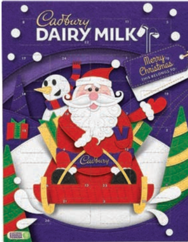
CHOCO CALENDAR 12 x 90g CAD-970636 7622300750367

Χριστουγεννιάτικη συλλογή από την CADBURY