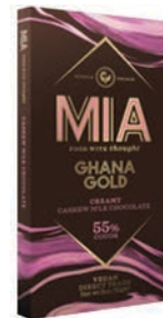
CASHEW MILK CHOCOLATE 55% 12 x 85g MIA-117 819229021174