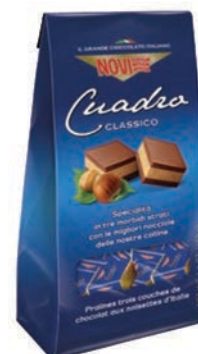
MILK PRALINS FILLED GIANDUJA 10 x 150g NOVI-3405 8006380234051