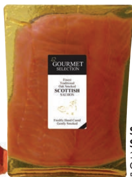
SCOTTISH SMOKED SALMON LONG SLICED 100g GS-LS-LS100 5200301861019