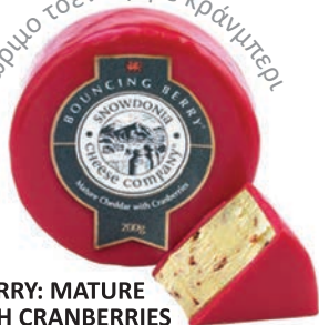
BOUNCING BERRY: MATURE CHEDDAR WITH CRANBERRIES 6 x 200g SNO-076 5060011709076