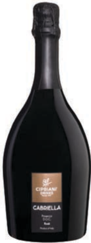
PROSECCO GABRIELLA 6 x 750ml CIP-5132 8009663089997