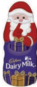
SANTA CLAUS MILK CHOCO 15 x 45g CAD-4084105 57027463