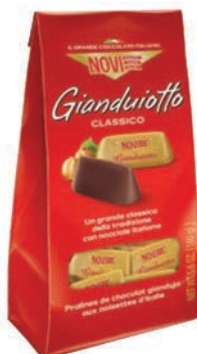
MILK PRALINS 10 x 160g NOVI-3306 8006380233061