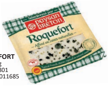
ROQUEFORT 16 x 100g PAB-116801 3412290011685