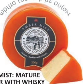
AMBER MIST: MATURE CHEDDAR WITH WHISKY 6 x 200g SNO-052 5060011709052