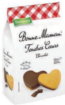
CHOCOLATE COVERED CAKE 7 x 175g BM-042271 3178530422719