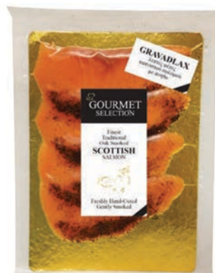
SCOTTISH SMOKED SALMON GRAVDLAX D-SLICED 100g GS-D-GRA100 5200301861040