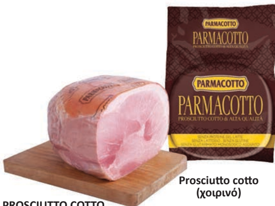
Prosciutto cotto (χοιρινό)

Το prosciutto cotto είναι μαγειρεμένο ζαμπόν που λαμβάνεται μετά το μαγείρεμα του χοιρινού ποδιού.