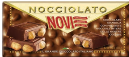
GIANDUJA ME ΦΟΥΝΤΟΥΚΙΑ 16 x 130g NOVI-1708 8006380217085

Gianduja είναι σοκολάτα η οποία περιέχει περίπου 30% πάστα φουντουκιού.