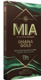
SEA SALT DARK CHOCOLATE 73% 12 x 85g MIA-108 819229021082