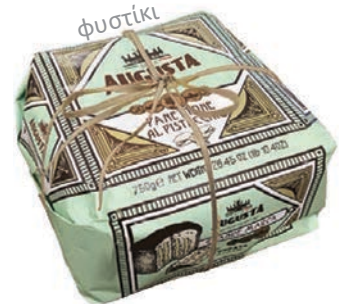
PANETTONE PISTACHIO 6 x 750g AUG-23171 8002873023171