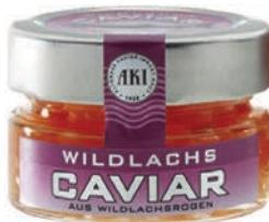
ΑΥΓΑ ΨΑΡΙΩΝ ΑΓΡΙΟΣ ΣΟΛΟΜΟΣ 10 x 100g AKI-50204 4103550010980