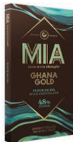
SALT BLOSSOM MILK CHOCOLATE 48% 12 x 85g MIA-114 819229021143