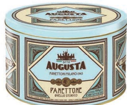
PANETTONE CLASSIC TIN 6 x 1000g AUG-23232 8002873023232