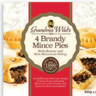
MINCE PIES 10 x 215g GMW-1013 5019605007814

Mince Pies: Τάρτες με brandy και γέμιση αποξηραμένων φρούτων και ξηρών καρπών.