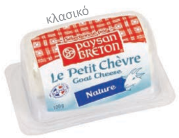
CHEVRE PLAIN 6 x 100g PAB-109601 3412290010961