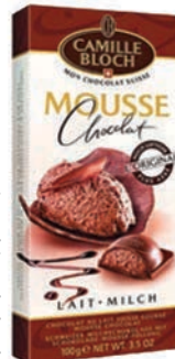
σοκολάτα γάλακτος με γέμιση μους