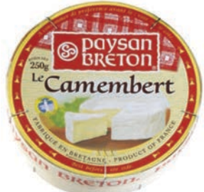
CAMEMBERT 6 x 250g PAB-935509 3184030003570