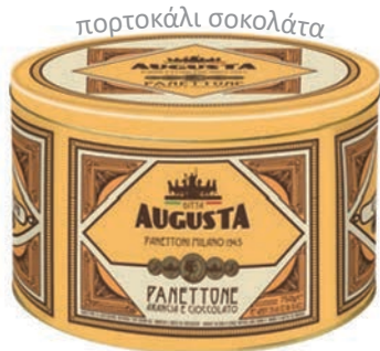
PANETTONE ORANGE CHOCOLATE TIN 6 x 750g AUG-38060 8002873013806