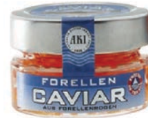
ΑΥΓΑ ΨΑΡΙΩΝ ΟΞΥΡΡΥΓΧΟΣ ΚΟΚΚΙΝΟΣ 6 x 50g AKI-53050R 4103550007041