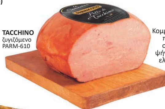
TACCHINO ζυγίζόμενο PARM-610

Κομμάτι ψητής γαλοπούλας που λαμβάνεται από ολόκληρο στήθος και ψήνεται με την προσθήκη ελάχιστων συστατικών.