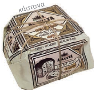
PANETTONE MARRONS 6 x 750g AUG-23492 8002873023492