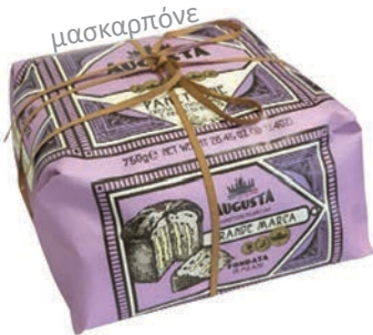
PANETTONE MASCARPONE 6 x 750g AUG-3813 8002873013813