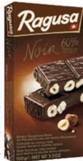
μαύρη σοκ. με γέμιση τρούφα / φουντούκια