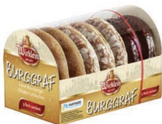
SOFT BISCUIT WITH 3 FLAVOURS 21 x 200g LEB-492 4008355000146