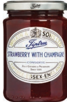
STRAWBERRY CHAMPAGNE 6 x 340g TIP-73711 043647737014