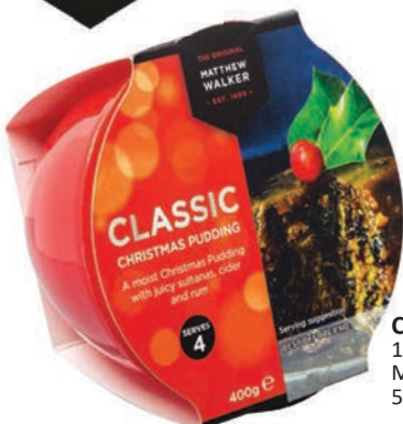
CLASSIC CHRISTMAS PUDDING 12 x 400g MW-950194 5010744001084