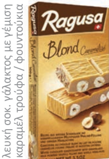
λευκή σοκ. γάλακτος με γέμιση καραμέλα τρούφα / φουντούκια