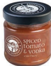
TOMATO VODKA CHUTNEY 12 x 100g SNO-690 5060011707690