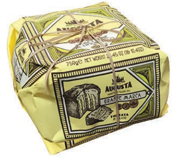
PANETTONE LIMONCELLO 6 x 750g AUG-23164 8002873023164